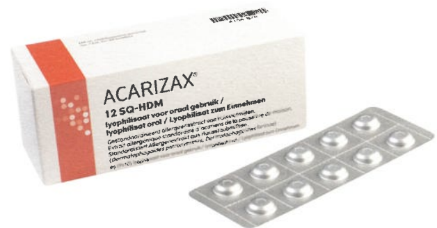
Acarizax 12 SQ boîte de 30 comprimés Acarizax 12 SQ boîte de 90 comprimés

Ce traitement a peu ou pas d'influence sur l'aptitude à la conduite ou à l'utilisation de machines. En cas de doute, consultez votre médecin ou pharmacien.